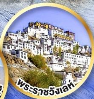
พระราชวังเลห์