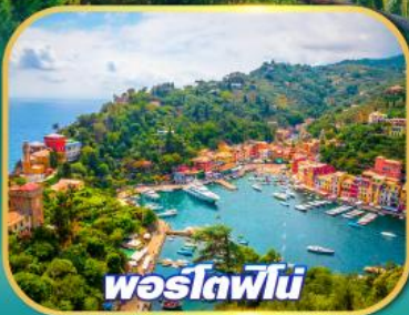
พอร์ตฟีโน