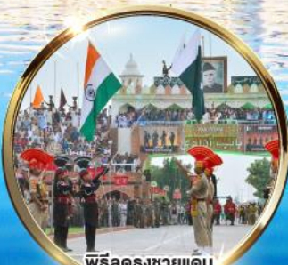
พิธีลดธงชัยแดน อินเดีย-ปากีสถาน ผ่านวากาห์