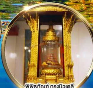
พิพิธภัณฑ์ กรุงนิวเดลี กราบมัสการพระบรมสารีริกธาตุ