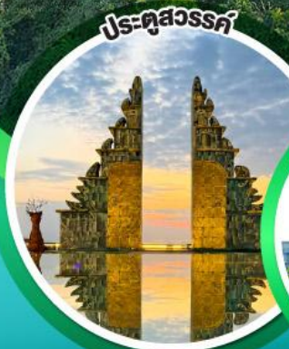
ประศุสวรรค์