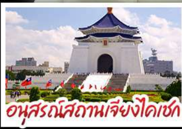
อนุสรณ์สถานเจียงไคเชก