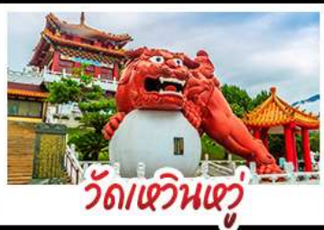
วัดเขวินเฮว

อวลีซาน - ทะเลสาบสุริยอันจินกรา - ไทเป101 วัดหวินหู้ - อนุสรณ์สถานเจียง ไคเชก วัดหลงซาน - ตลาดกลางคืนซีเหมินติง เมนู หมูหนึ่งจากรพรรดิ - เขียวหลงเป่า - ชาบูไต้หวัน