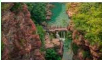
อุทยานสวรรค์หยุนโตซาน