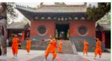
ชมโชว์กังฟูเส้าหลิน

*ทางบริษัทฯ ขอสงวนสิทธิ์ในการสลับโปรแกรมทัวร์ตามความเหมาะสมขึ้นอยู่กับสถานการณ์ปัจจุบัน โดยคำนึงถึงผลประโยชน์ของลูกค้าเป็นสำคัญ