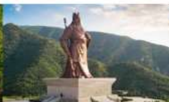
บ้านเกิดกวนอู