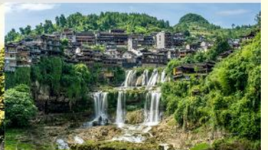
หมู่บ้านโบราณผู่หลงเจิน

*ทางบริษัทฯ ขอสงวนสิทธิ์ในการสลับโปรแกรมทัวร์ตามความเหมาะสมขึ้นอยู่กับสถานการณ์หน้างาน โดยคำนึงถึงผลประโยชน์ของลูกค้าเป็นสำคัญ