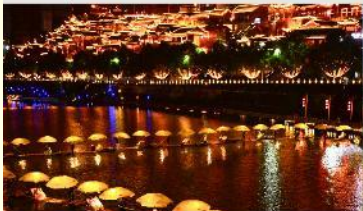
เมืองเซียนเอิน