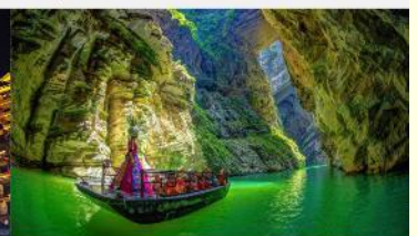
แกรนด์แคนยอนผิงซาน

*ทางบริษัทฯ ขอสงวนสิทธิ์ในการสลับโปรแกรมทัวร์ตามความเหมาะสมขึ้นอยู่กับสถานการณ์หน้างาน โดยคำนึงถึงผลประโยชน์ของลูกค้าเป็นสำคัญ