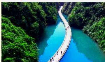
ขุนเขาสิงโต