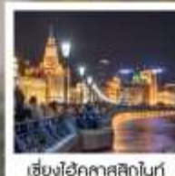
เซี่ยงไฮ้คาสสิกไนท์