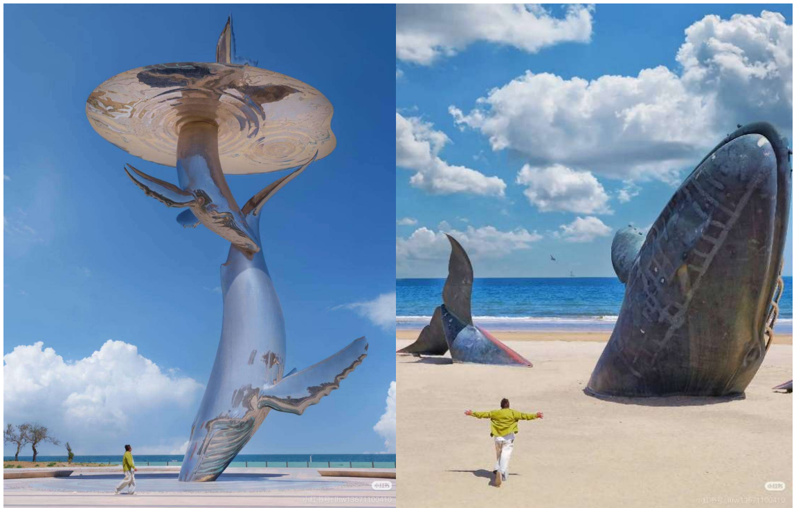
T2G-TNA02SL Flower of Qingdao...จินนาน ซิงเต่า เหียนไถ เกย์ไห่ 6D 5N (SL)

ชายหาดทรายสีทอง สถานที่ท่องเที่ยวระดับ 4A แนวชายหาดยาวมีความยาวประมาณ 10 กิโลเมตร จุดเด่น ของชายหาดที่นี่คือมีทรายละเอียดและสีทองระยิบระยับ เมื่อโดนแดดจึงดูสวยงามมากและน้ำทะเลสะอาด และห้ามพลาดกับจุดเช็คอิน รูปปั้นปลาฉลาม สุดไวรัลที่ใครๆมาแล้วต้องมาเช็คอิน