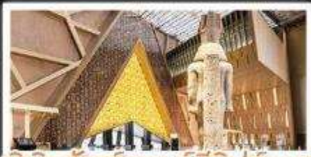
พิพิธภัณฑ์แกรนด์อียิปต์(GEM)

อารยธรรมลุ่มแม่น้ำไนล์ - พีรามิด - อเล็กซานเดรีย - เมมฟิส - ไคโร - โรงแรมระดับ 4 ดาว รวมค่าวีซู่ ตะลุยกะเลทราย - อาหารครบทุกมื้อ