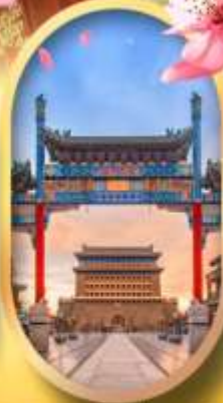
ถนนคนเดินเจียมเหมิน