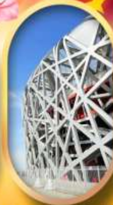
ผ่านชมสนามกีฬาโอลิมปิก