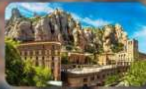
เขามอนต์เซอรัลด์