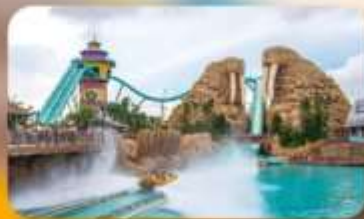
Chimelong Ocean Kingdom