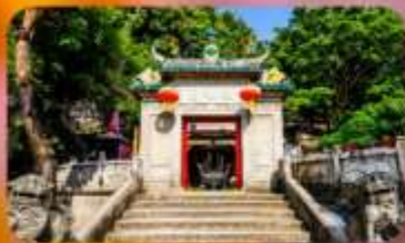
วัดอาเมา