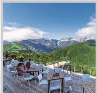
“HAKUBA MOUNTAIN HARBOR”

นำท่านไปโอบกอดธรรมชาติที่ครบครันในที่เดียว “คามิโคจิ” สวิสเซอร์แลนด์แดนญี่ปุ่นเทือกเขาที่ปกคลุมด้วยหิมะสวยงาม ชมความงามของ “ทุ่งพืชมอส ฟุจิชิบะซากุระ” มนต์เสน่ห์..พรมธรรมชาติสีชมพูหลากสีสดใส เปลี่ยนอริยบท “จีนกระเช้าฮาคุบะ อิวะตะเกะ” เพื่อชมวิวพาโนรามาของเทือกเขาแอลป์ญี่ปุ่นกันให้อิ่มใจ สัมผัสกลิ่นอายเมืองเก่า “เมืองทาคายามา” ที่ยังคงอนุรักษ์ความเป็นอยู่ เมื่อสมัยเอโดะกว่า 300 ปี สายช้อปปิ้งห้ามพลาด “คารุอิซาวะ เอ้าท์เล็ต” แลนด์มาร์กของเมืองคารุอิซาวะ และ “ย่านชินจูกุ” แห่งเมืองโตเกียว ชมความงามกับเส้นทาง “เจแปนแอลป์ (กำแพงหิมะ)” สุดยอดของการท่องเที่ยวที่ถูกขนานนามว่า “หลังคาแห่งญี่ปุ่น”