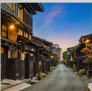
“TAKAYAMA OLD TOWN”