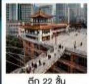
ตึก 22 ชั้น