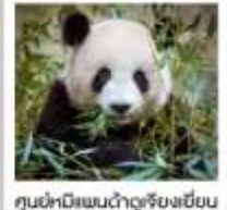
ศูนย์หมีแพนด้าจู่เจียงเยียน