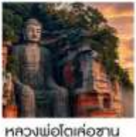
หวงโถ่เค่อซาน