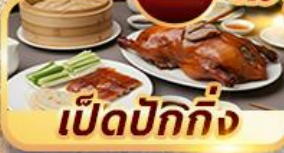
เป็ดปักกิ่ง