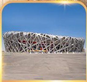
สนามกีฬาแห่งชาติ