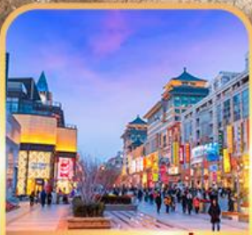
ถนนหวงฟู่จิ่ง