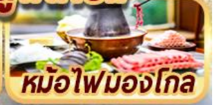
หม้อไฟมองโกล