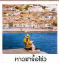
หาดซาโจ่วไฮ่

เรือยวี่ / ย่านฉินเหล่ฟาง / สวนเว่ยไห่ / WEI HAI WINDOW / ถนนฮวงวีป้า สวนหย่อมโกทอน / เมืองท่าฮั่วฉิงไห่ / หอคอยทาคองคา / สามหาดจินซา / รูปปั้นปลาฉลาม แปดเซียนซำทง / หาดทรายซาโจ่วไฮ่ / หาดไซเบอร์ NO.3 / สวนจงซาน / ถนนหลงเจียง พิพิธภัณฑ์ที่ว่าการท่าเรือ / Silver Fish St. / สะพานจินเจียว / โบสถ์ St. Emil ถนนเป่าฉ่าทง / ห้างเว่ยซานไห่เจียม NIGHT MARKET / QINGDAO HAITIAN CENTER ชั้นB1 โรงงานเบียร์ชิงเต่า / ถนนเลียบชายหาดปิ่นไห่ปูจ้านเต่า / ถนนคนเดินไถ่ตง