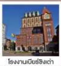
โรงงานเบียร์ชิงเต่า