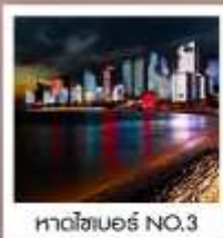
หาดไซเบอร์ NO.3

ชิมฟรี!! ...เบียร์ชิงเต่า สูตรออริจินัลดั้งเดิม ...ท่านละ 1 แก้ว