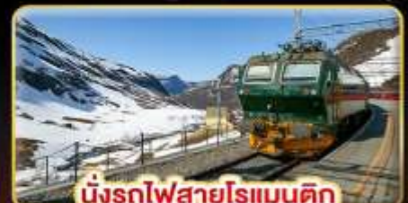
นั่งรถไฟสายโรแมนติก “พร้อมสปาานา”