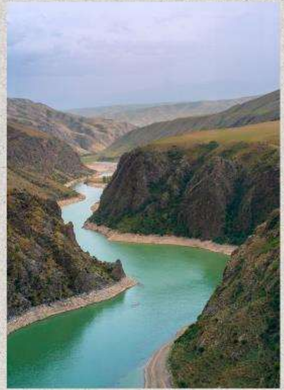
แกรนด์แคนยอนคุโคซู