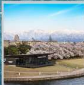
"TOYAMA KANSUI PARK"