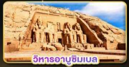
วิหารอาบูซิมเบล

น้ำหนักกระเป๋า 23Kg. (บนเครื่องปรเภท และบินภายใน)