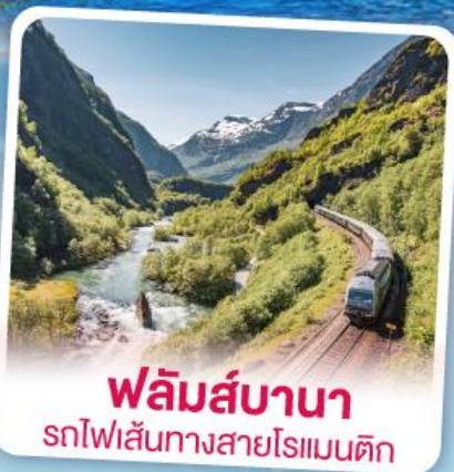
ฟลัมส์บานา รถไฟเส้นทางสายโรแมนติก