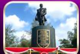
อนุสาวรีย์กรมหลวงชุมพรฯ