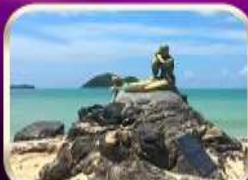
เที่ยวหาดสมิหลา สงขลา