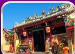
ศาลเจ้าแม่ลิ้มกอเหนี่ยว

ที่เที่ยวเพิ่มขึ้น และ ช่วยฟื้นฟูเศรษฐกิจภาคใหญ่