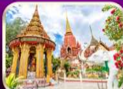
หอพระหลวงปู่ทวด วัดช้างให้