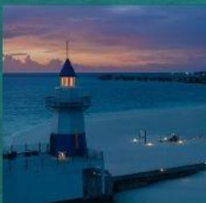
Light House Restaurant