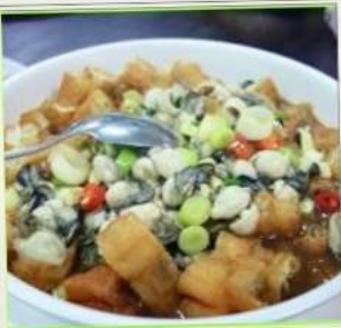
ถนนโบราณซือเฟิ่น